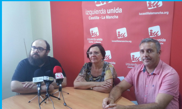
Visita a Villarrobledo.