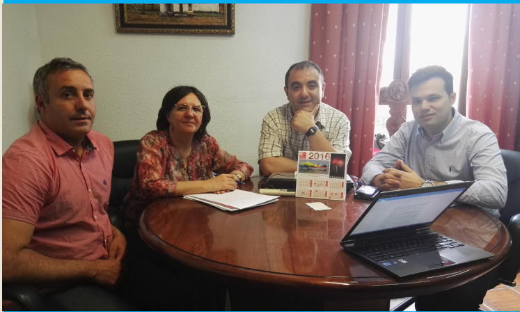
Encuentro de trabajo en Tarazona de La Mancha.