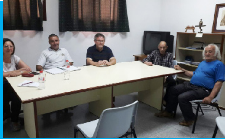
Ruñión con los diputados provinciales en Fuensanta.