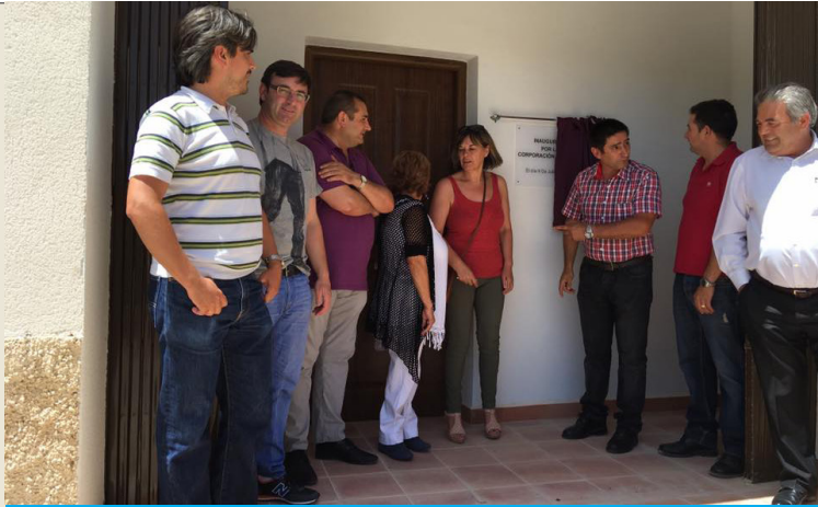
Inauguración del Centro Cultural de Pesebre, Peñascosa.