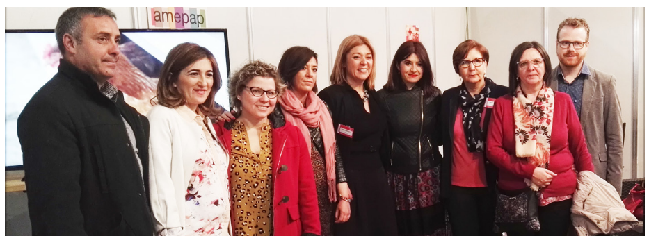
Los diputados provinciales de Ganemos-IU visitaron Expovicaman. En la imagen, un momento del encuentro que tuvieron con mujeres empresarias de la provincia.

Para Sánchez “lo lamentable” de esta situación es que los responsables de la mala gestión aquellos que generaron la deuda “están tranquilos en el sillón de su casa”.