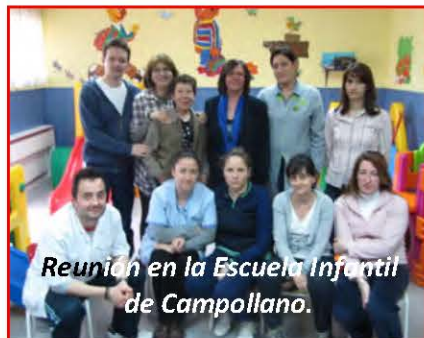
Reunión en la Escuela Infantil de Campollano.

El Plan de Ajuste del PP ejerce un efecto demoledor contra la ciudadanía y los empleados municipales: despidos, recortes y cierres de servicios públicos. Frente a ello, IU plantea una alternativa justa y solidaria.