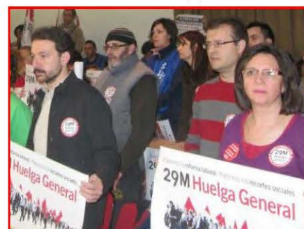
La política antisocial del PP provoca constantes protestas. En la imagen, el Salón de Plenos el 29M.